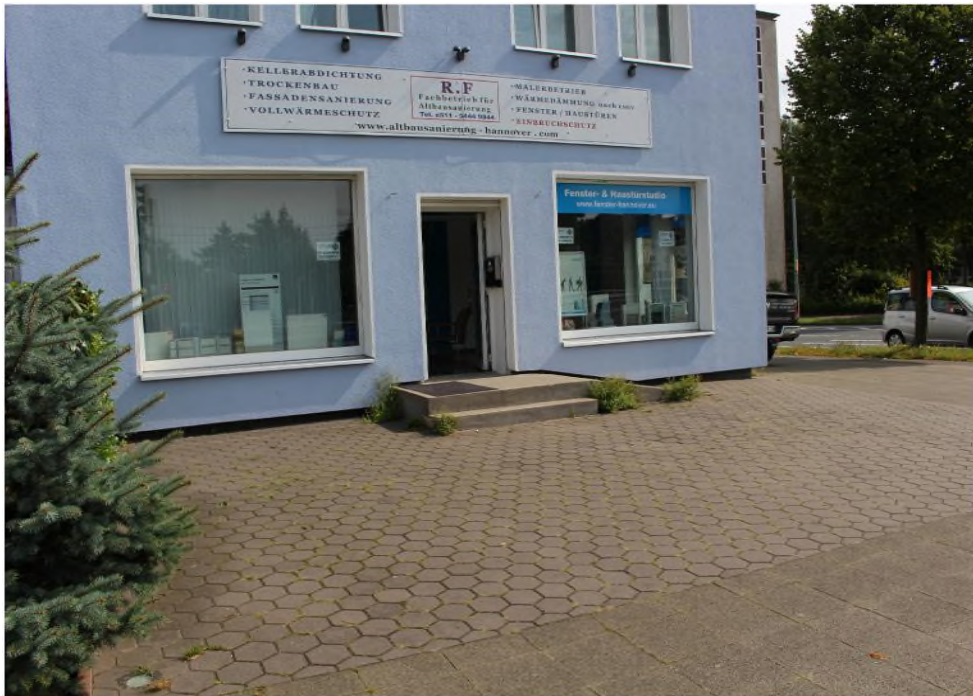
Ladenfläche/ Ausstellungsraum 1